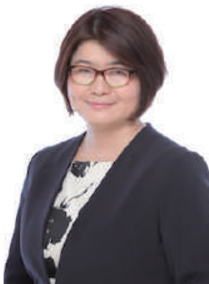
ちよんせいこ 株式会社ひとまち