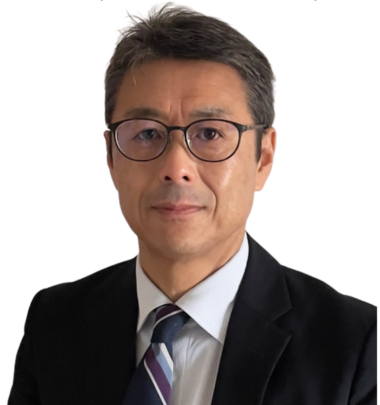
上越教育大学教職大学院 教授 ホワイトボード・ミーティング®認定講師