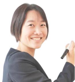
甫仮南欧美 (小6ママ)

3年前から娘もファシリテーターの練習をスタート。安心安全な場で、大人と一緒に対話や話し合いを楽しんでいます。